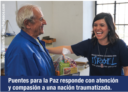
Puentes para la Paz responde con atención y compasión a una nación traumatizada.

Una de las funciones clave de la Corte Penal Internacional (CPI) es llevar ante la justicia a los criminales de guerra que viven en naciones cuyos sistemas judiciales son considerados corruptos y fallidos. Sin embargo, la CPI demostró recientemente su depravación inmoral y antisemita al emitir órdenes de arresto contra el primer ministro israelí, Benjamín Netanyahu, y el ex ministro de Defensa, Yoav Gallant. Este hecho hace referencia a la Escritura que se encuentra en Jueces 17:6b: "Cada uno hacía lo que le parecía bien ante sus propios ojos" (NBLA).