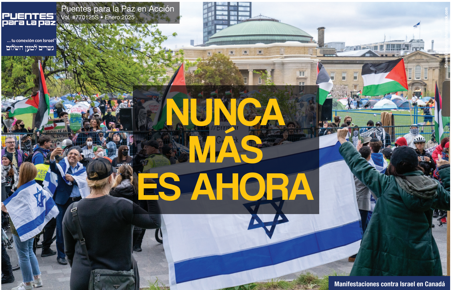
Manifestaciones contra Israel en Canadá

DURANTE MÁS DE UN AÑO , Israel ha recibido ataques desde siete frentes diferentes: por parte de Jizbolá en el Líbano; de Hamás en Gaza y Judea y Samaria (Cisjordania); de los hutíes en Yemen; del Cuerpo de la Guardia Revolucionaria Iraní (CGRI) en Irak y Siria; y por el régimen iraní de forma directa. Sin embargo, y contra todo pronóstico, Israel resiste.